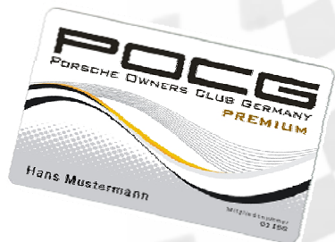
Mitgliedskarte - Premium Mitglieder

Details zur den beiden Formen der Mitgliedschaft findet man auf unserer Internetseite.